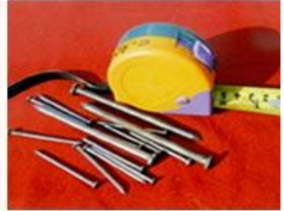
ដែកគោល ខ្សែម៉ែត្រ