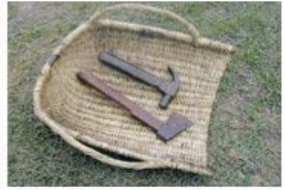
ញញូរ តូចៅ បង្ហី