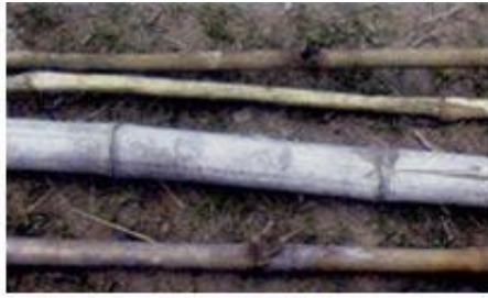
ឫស្សី កូនឈើ