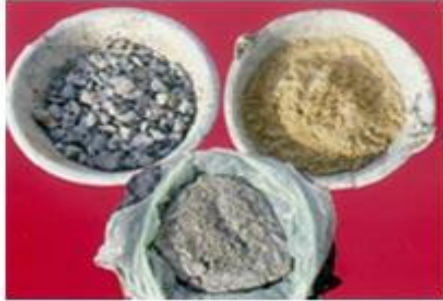
ថ្ម ខ្សាច់ ស៊ីម៉ង់ត៍