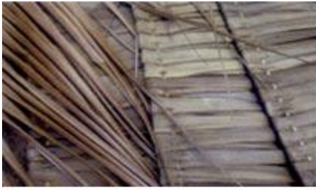
ស្លឹកដូង ស្លឹកត្នោត