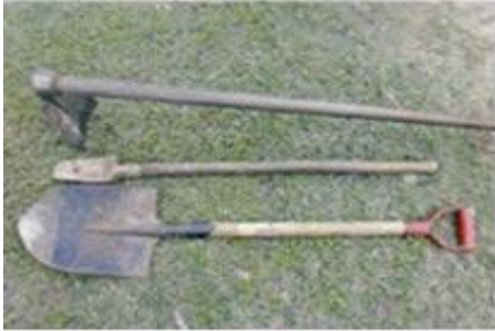
ចបកាប់ ចប់ជីក បែល